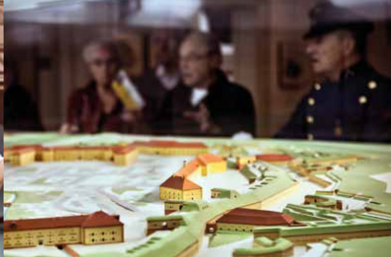
Eindrucksvoll ist auch das große Festungsmodell, das deutlich die ehemalige Ausdehnung der gesamten Festung und das „neupreu-Bische“ System ihrer Befestigung erkennen lässt.